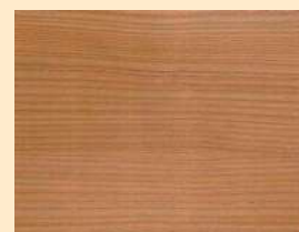
Lärche Nr. 110-89