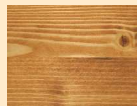
Teak Nr. 110-81